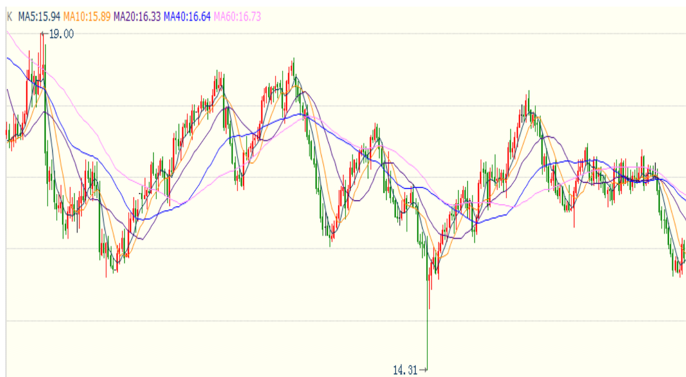
图2 国际白银现货走势（日线图，2016-10至2017-12）