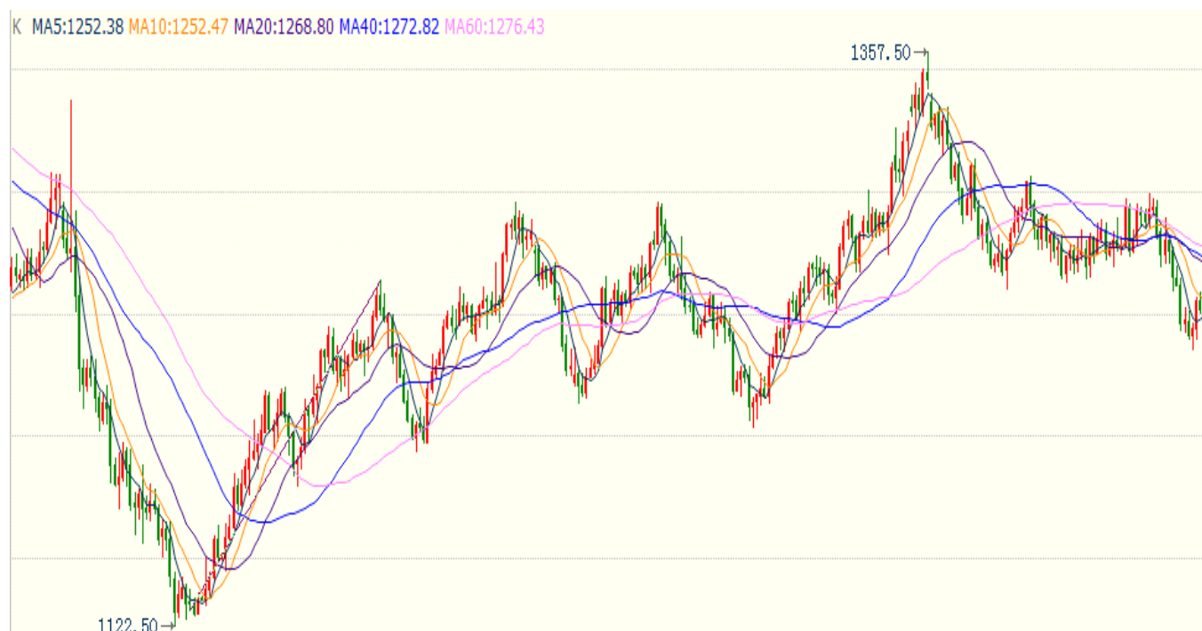
图1 国际黄金现货走势（日线图，2016-10至2017-12）