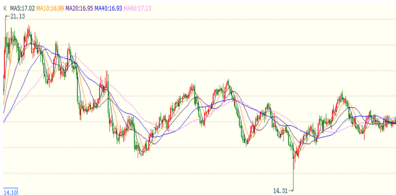
图 2 国际白银现货走势（日线图，2016-6 至 2017-11）