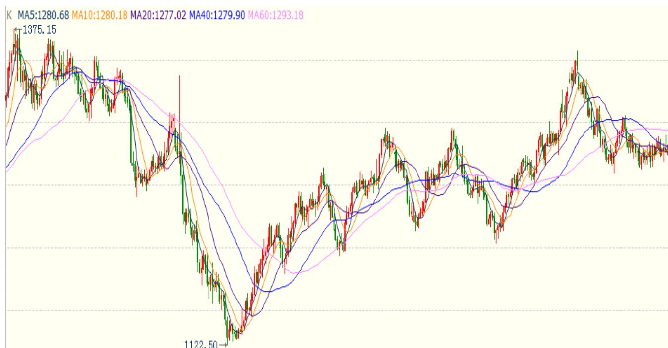
图 1 国际黄金现货走势（日线图，2016-6 至 2017-11）